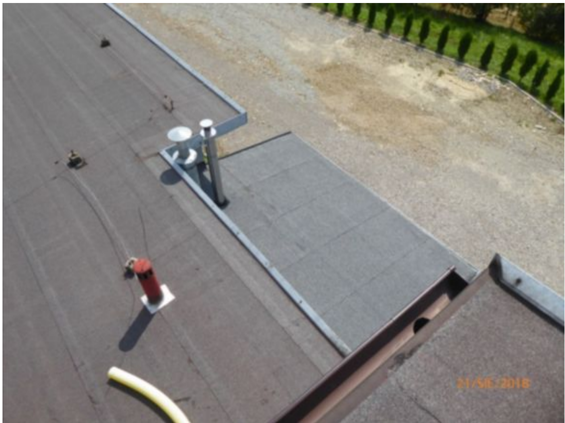
widok na dach kotłowni dobudowanej w 2014r