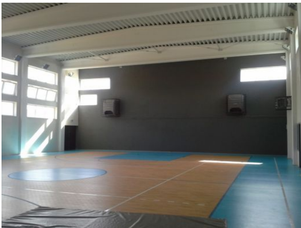
fragment sali gimnastycznej zrealizowanej w 2014r