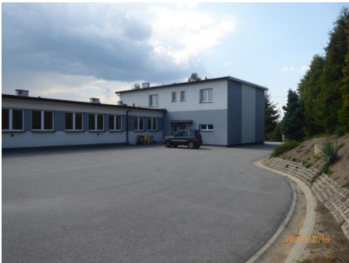
widok na stara część szkoły od strony dziedzińca