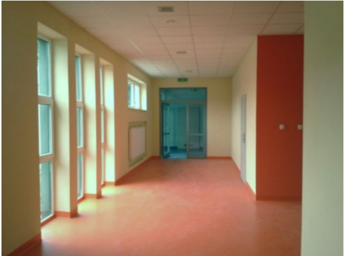
korytarz w nowej części dobudowanej w 2014r