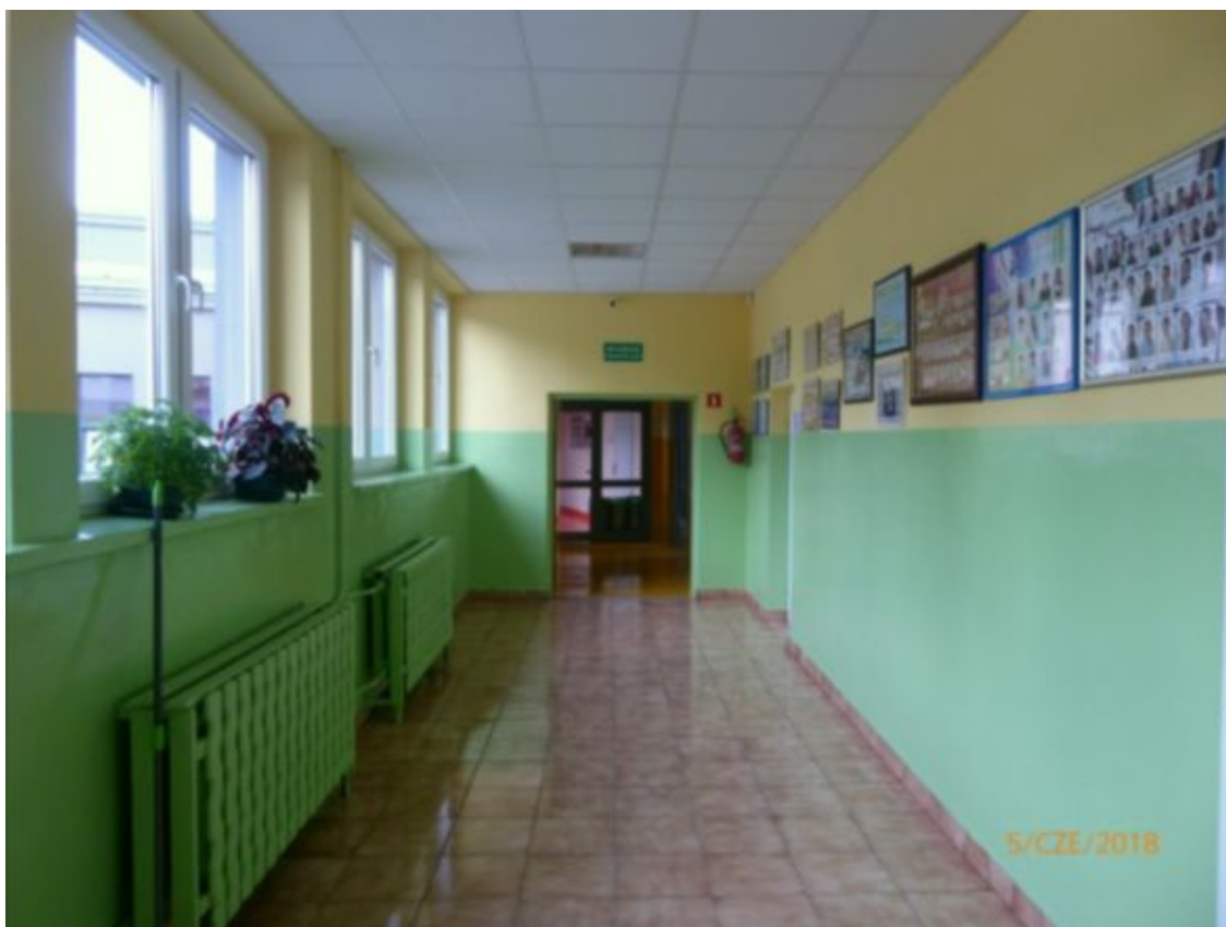
korytarz części parterowej starej szkoły, widok od strony części dwukondygnacyjnej