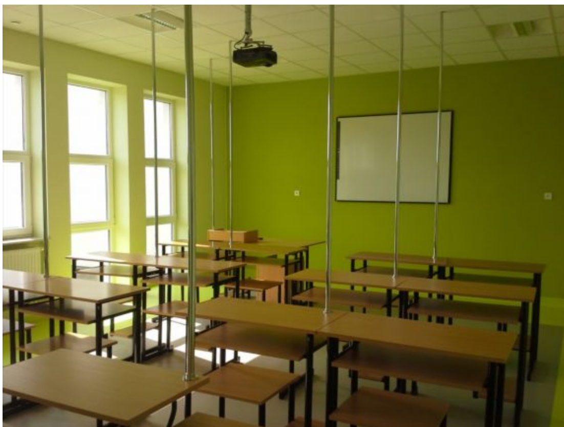
pracownia informatyczna przy sali gimnastycznej w nowej części z 2014r