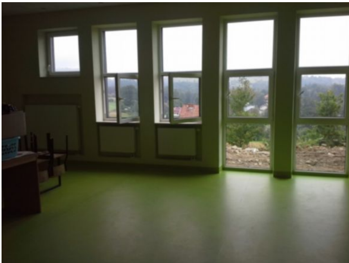
sala lekcyjna przy sali gimnastycznej w nowej dobudowanej w 2014 r części szkoły