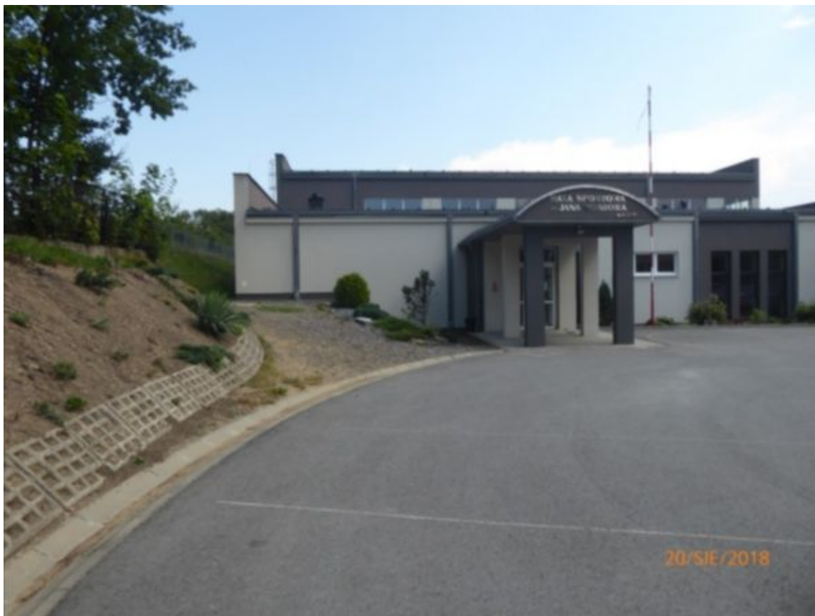
widok na wejście do sali gimnastycznej od strony dziedzińca