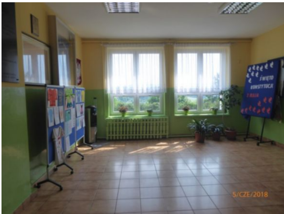
hol na parterze w części dwukondygnacyjnej