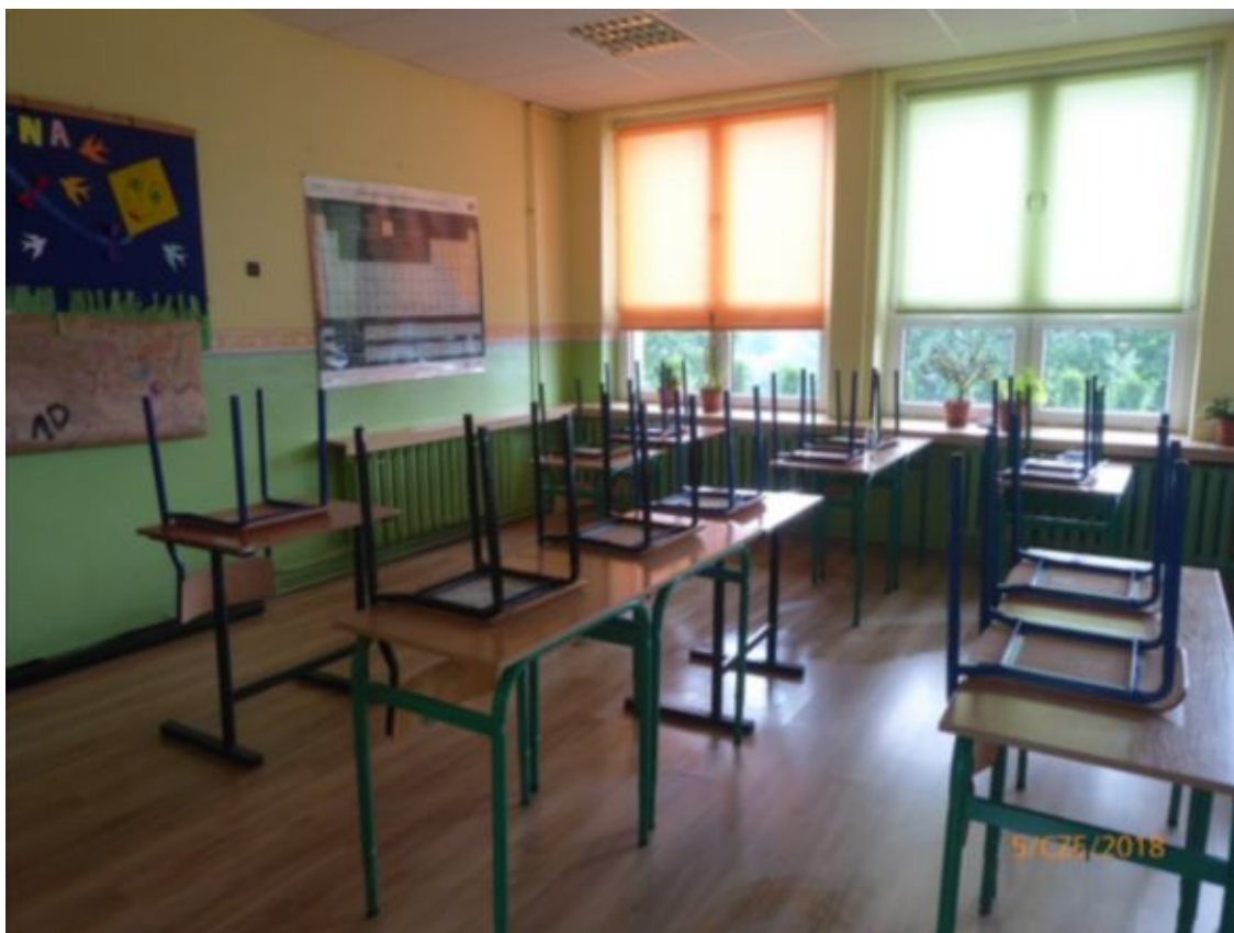
jedna z sal lekcyjnych w części parterowej starej szkoły