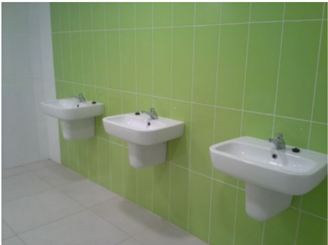
fragment łazienki z części szatniowej sali gimnastycznej z 2014 r