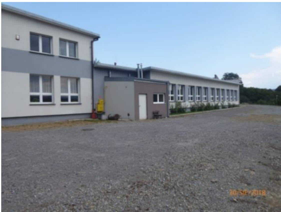
widok na elewację południową, widoczna dobudowana w 2014r kotłownia