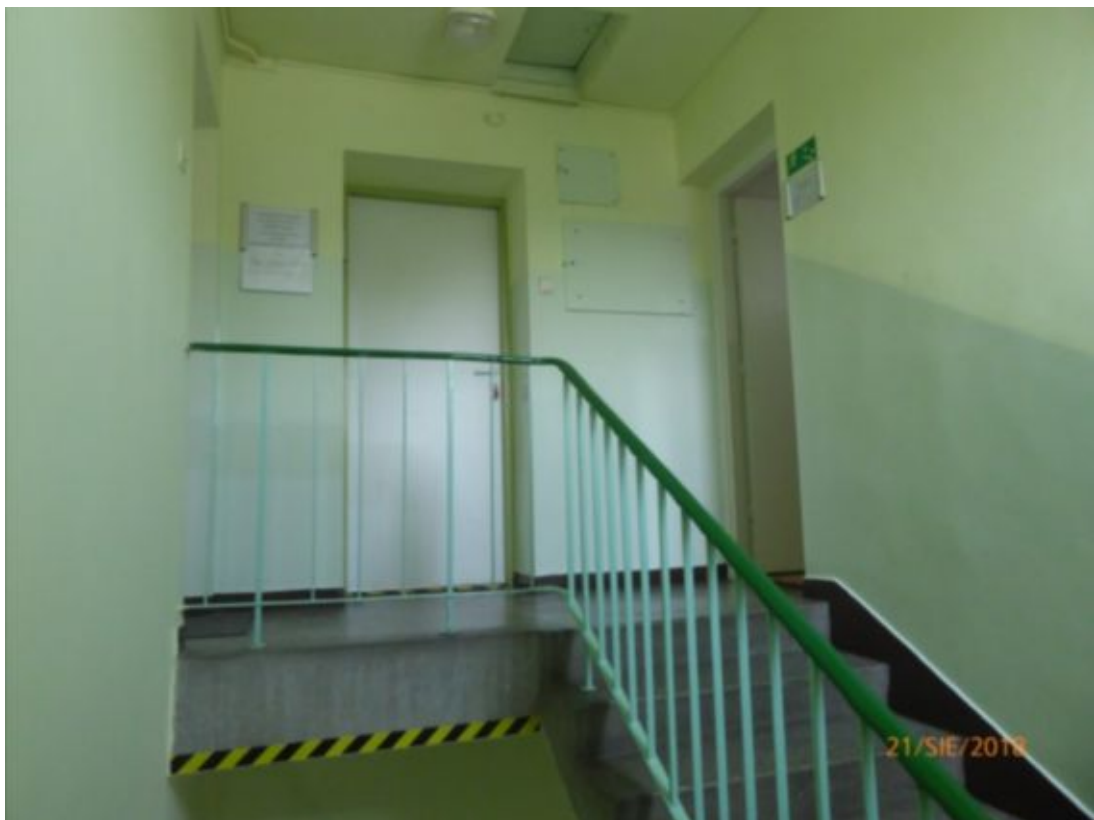
klatka schodowa w części dwukondygnacyjnej