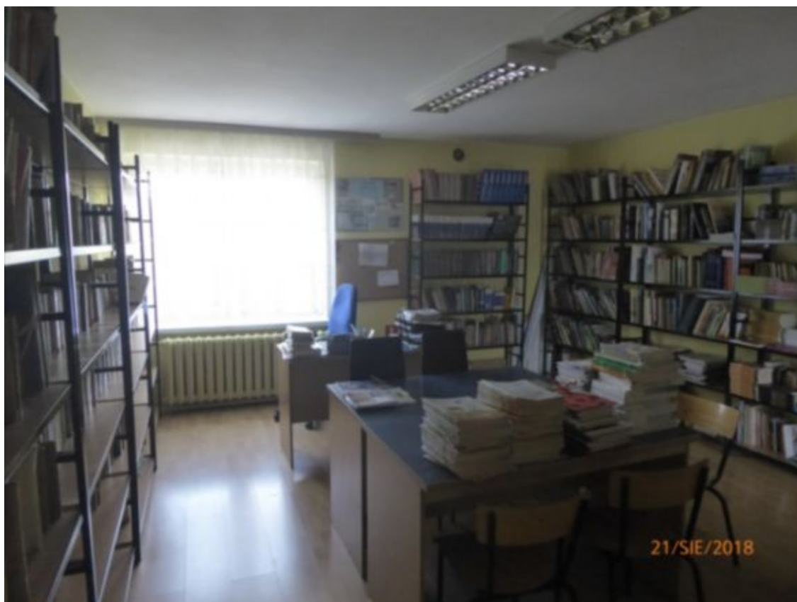
pomieszczenie biblioteki szkolnej na piętrze w części dwukondygnacyjnej