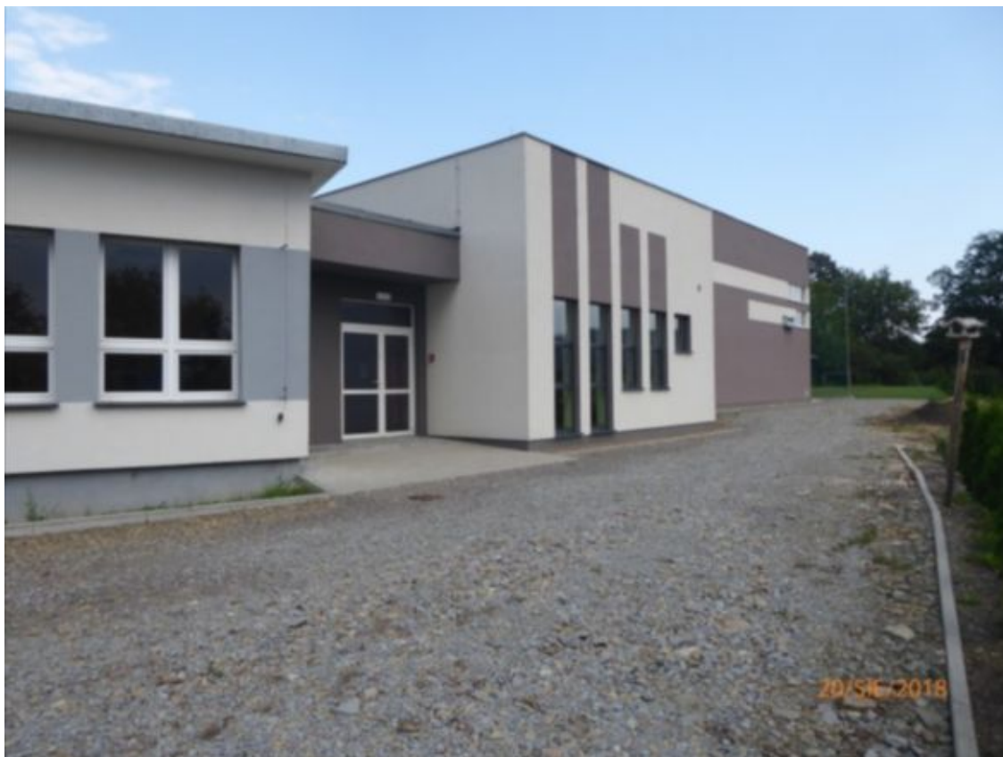
widok na połączenie starej części szkoły z salą gimnastyczną od str. południowej