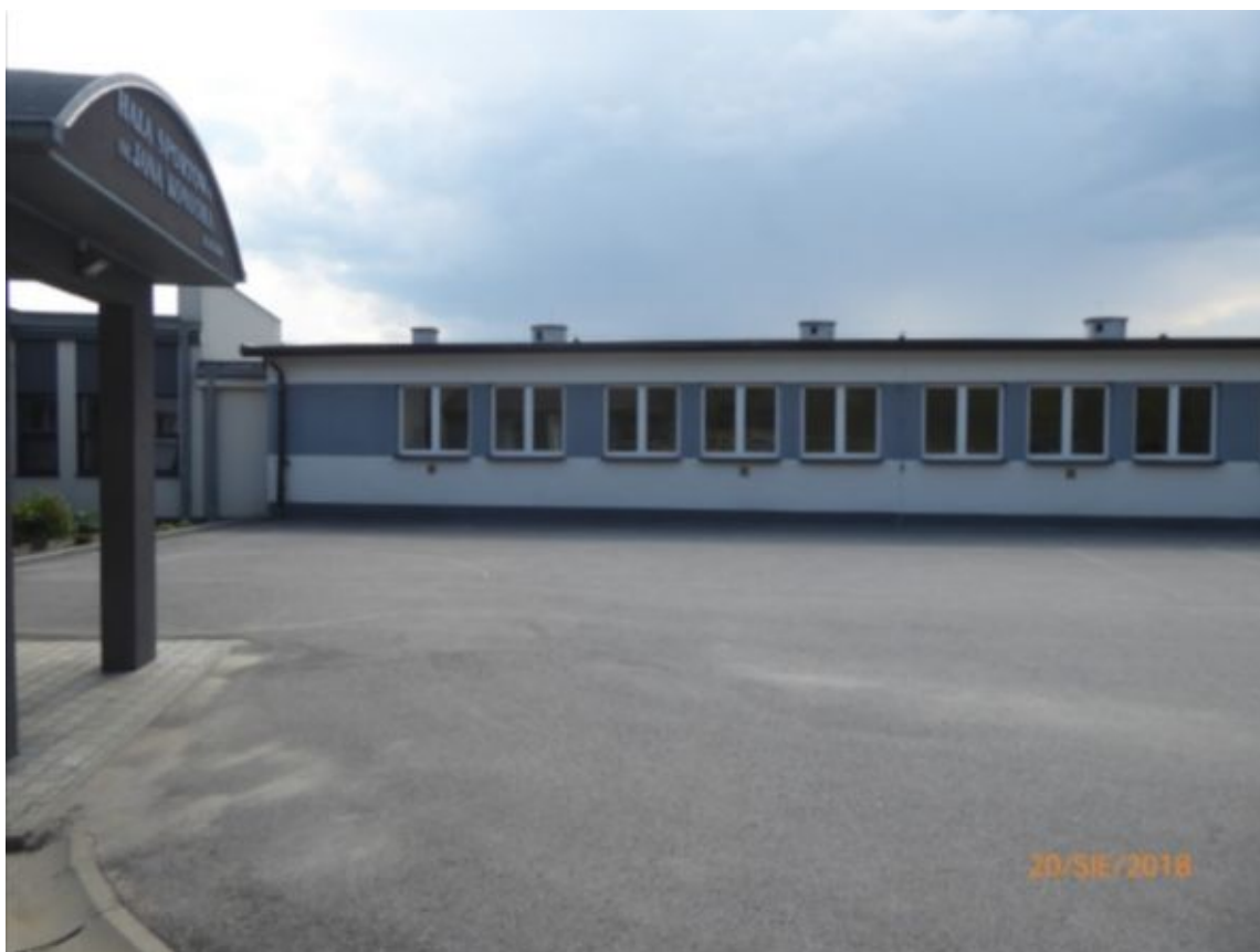
widok na połączenie starej części szkoły z salą gimnastyczną od strony dziedzińca