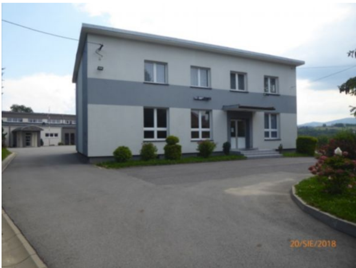
widok na dwukondygnacyjną część szkoły, w głębi wejście do sali gimnastycznej