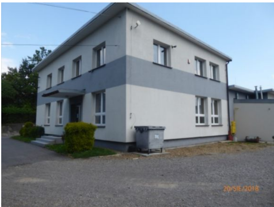
widok na dwukondygnacyjną część szkoły od strony południowo zachodniej