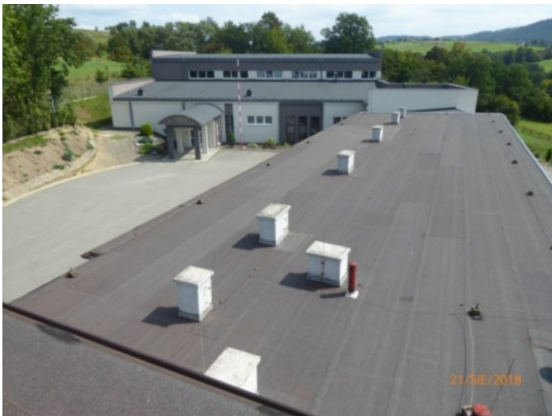
widok jak wyżej , z krawędzi dachu części dwukondygnacyjnej