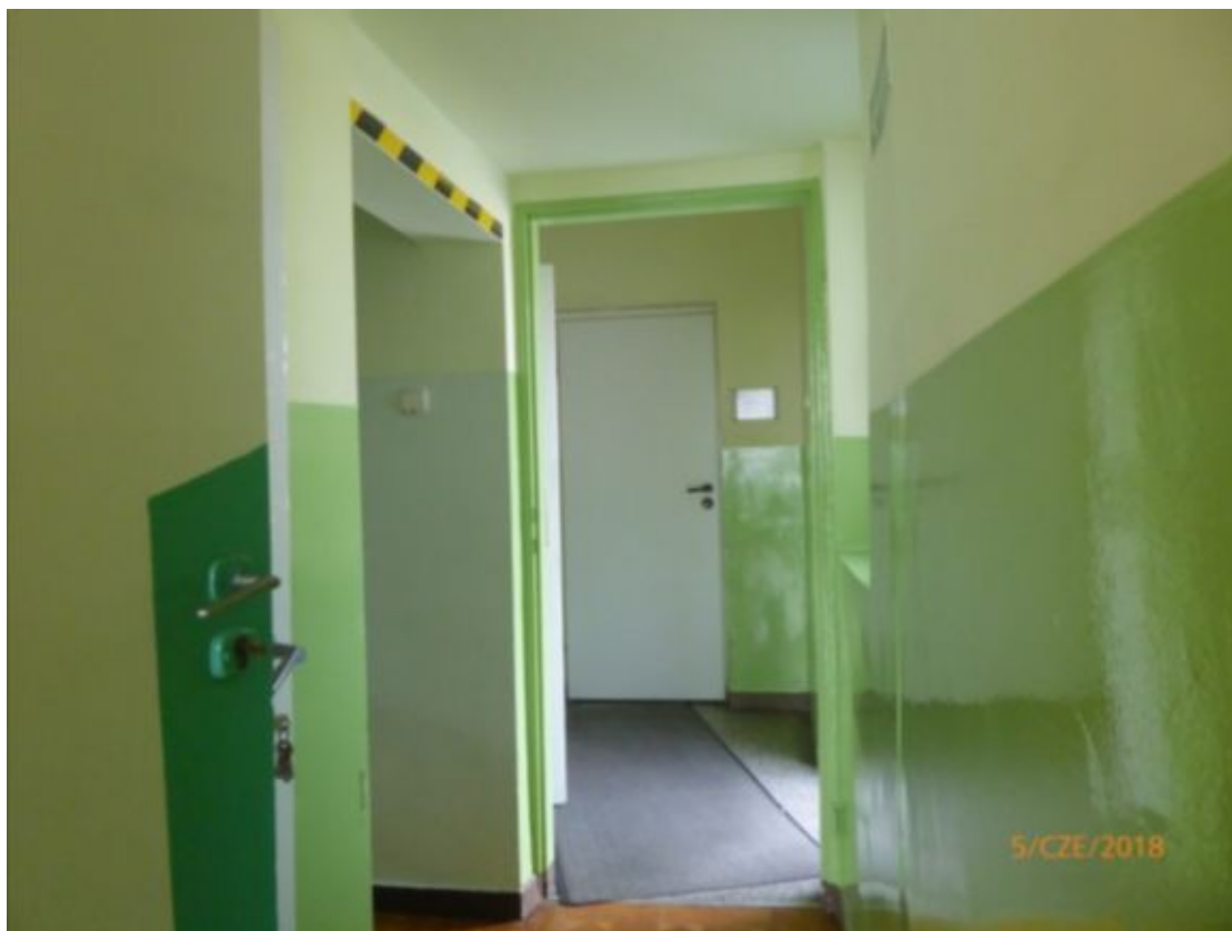
zaplecze na parterze przy klatce schodowej w części dwukondygnacyjnej szkoły