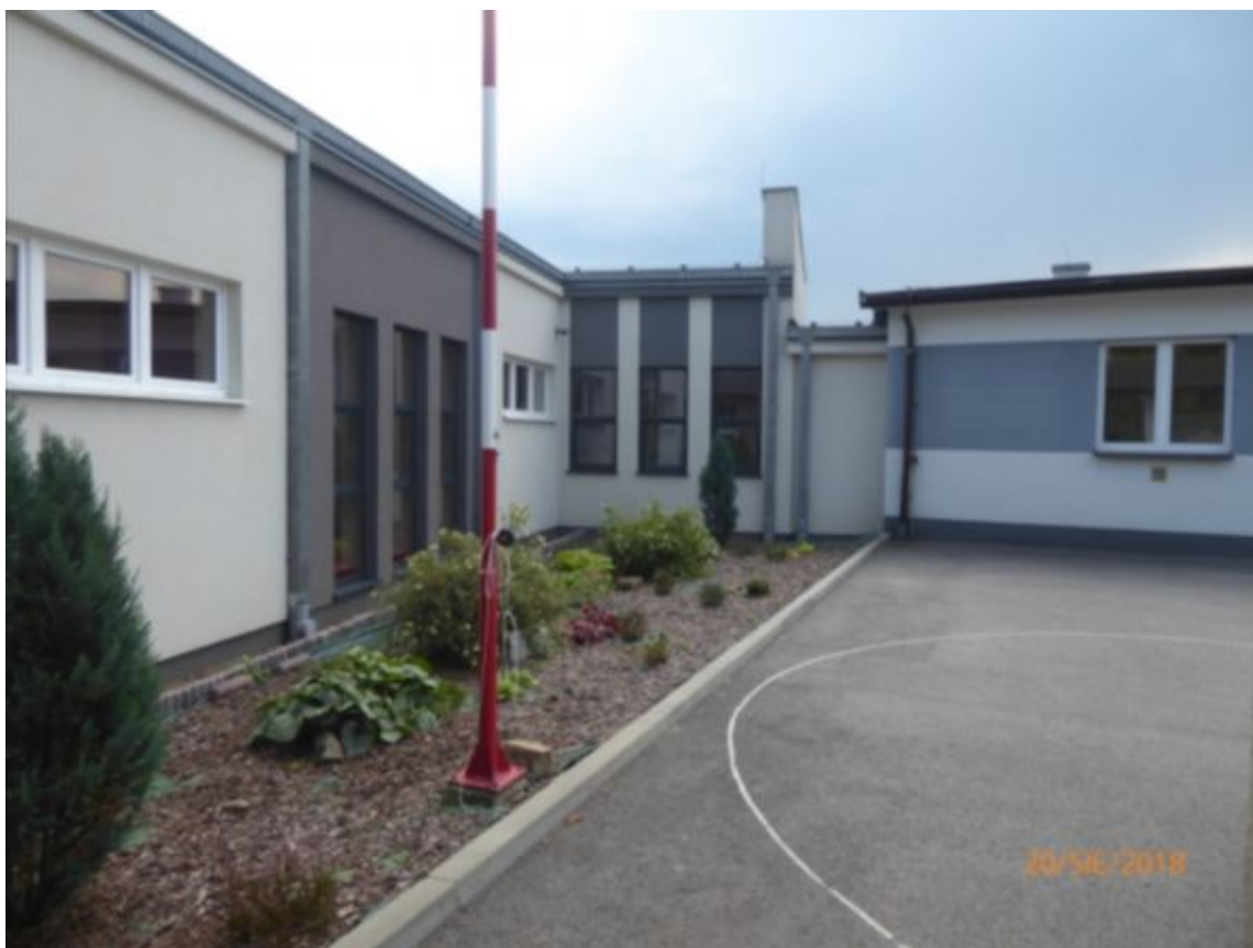
widok jak wyżej z fragmentem zieleni adaptowanej w proj. na patio