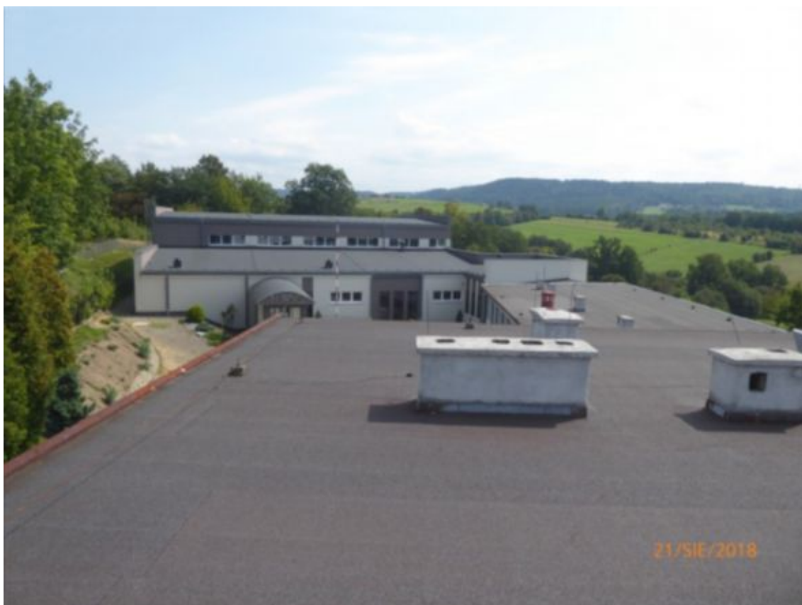
widok dachu w kierunku sali gimnastycznej z części dwukondygnacyjnej